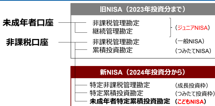
図表 1 : NISA における口座と勘定の関係