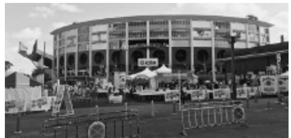
図7 宮城野原公園とKoboパーク宮城

プロ野球、東北楽天ゴールデンイーグルスの本拠地の宮城球場（Koboパーク宮城、図7）は、宮城県立宮城野原公園にある。1950年竣工で老朽化が著しく、楽天イーグルスの進出に合わせ大幅に改装した。04年に締結した「宮城球場フランチャイズ基本協定」はプロ野球の興行に合わせた大胆な改装を認めるものだった。協定に基づき、進出1年目のシーズンをはさみ2期にわたる工事費用の約70億円は、球団と球場の両方を運営する株式会社楽天野球団が負担し、改修に伴う設備造作は宮城県に寄附することになった。代わりに向こう15年間にわたって球場を管理し、プロ野球の興行や物販等の目的で使用できる権利を得た。県に球場の使用料を支払う必要があるが、入場料、広告料、店舗でのグッズ販売や飲食サービスに伴う収入は会社に帰属する。