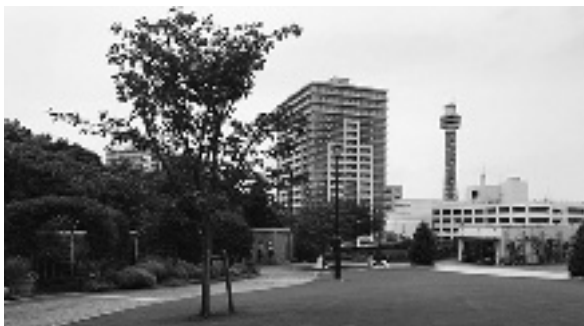
図6 アメリカ山公園

わが国はじめての「立体都市公園」であるアメリカ山公園（横浜市、図6）も面白い。園地は、外国人墓地に連なる台地のふちに、地下鉄みなとみらい線の元町・中華街駅の上の地上4階建て建物の屋上をつなげて作った平面上にある。まるでデパートの屋上の公園のようである。西武造園株式会社を代表企業とするコンソーシアム「アメリカ山公園パートナーズ」が市から管理許可を得て、園地と収益施設をまとめて管理運営している。収益施設は公園の真下、つまり建物の3階、4階部分にある。4階は結婚式場で、公園で挙げるガーデンウェディングがセールスポイントだ。収益施設で得られる収益から園地の管理費が賄われ、市には使用料が支払われる。