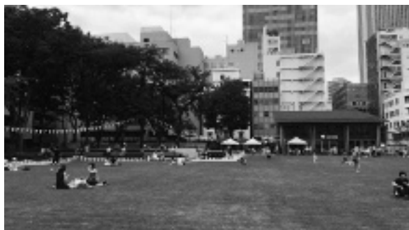
図3 南池袋公園とラシーヌ ファーム トゥー パーク

2016年、豊島区の南池袋公園がリニューアルした。園内の「ラシーヌ ファーム トゥー パーク」(図3)には様々な銘柄のクラフトビールをはじめ酒類メニューがあり、芝生に面したテラス席でビールやワインを楽しむことができる。2階建ての店舗は公園管理者の豊島区が整備した。公募で選ばれた民間事業者が区の設置等許可を得て内装工事を施し、独立採算の下でカフェを経営している。豊島区に対しては固定分と歩合分からなる使用料を支払う。なお店内のトイレは公園のトイレでもあり、公園利用者との共用である。