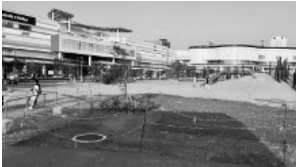
図5 豊砂公園とイオンモール

ショッピングモールの売上にも貢献する。間接的には、公園目当てに来た家族連れが立ち寄ることでショッピングモールの客数が増えるメリットがある。子どもを公園で遊ばせて、その間ショッピングモールでゆっくり買い物をする効用もある。