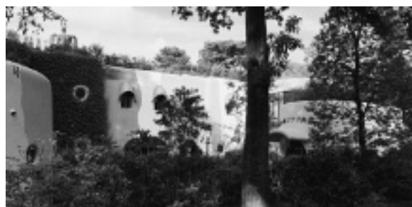
図8 井の頭恩賜公園と三鷹の森ジブリ美術館

美術館は井の頭恩賜公園の集客に大いに貢献している。01年の開館直後から盛況で、入場時間を1日4回に制限した完全予約制だが、開館16年と