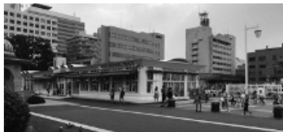
図4 山下公園とレストハウス(ローソン)

横浜市の山下公園にあるレストハウス(図4)はコンビニエンスストア、休憩所及びトイレで構成され、高速道路のサービスエリアのような施設である。株式会社ローソンが市の管理許可を得て施設の管理運営を担っている。使用料を市に支払ったうえでコンビニを営業し、施設の日常的な管理の一環としてトイレ、休憩所の清掃などを実施している。市から見れば「売店(物品の販売・軽飲食)を備えた休憩所及びトイレ」(運営事業者公募要項)であり、休憩所、トイレをいつもきれいに使えるよう、コンビニ営業の収益をセットにして日常業務を民間事業者に委託したようなものだ。