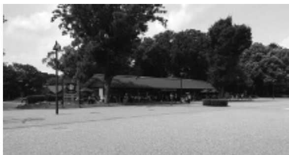
図2 上野恩賜公園とスターバックスコーヒー

2)。そのうちスターバックスコーヒーはそれまで富山市の富山環水公園、福岡市の大濠公園に出店しており、上野恩賜公園は3例目だった。東京都が店舗を整備し、公益財団法人東京都公園協会に管理許可を付与している。カフェ事業者はテナントとして入居し、賃料以外に収益の一部を公園協会に支払っている。公園協会はそれを使って水上花壇の整備など公園の魅力向上に取り組んでいる。